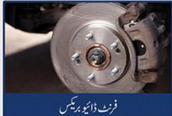
فرنٹ ڈائو بریکس

نئی اور پہلے سے بہتر FAW CARRIER ⊕ کو خاص پاکستانی، دشوار گزار راستوں پر بہترین کارکردگی کے لیے تیار کیا گیا ہے۔ اس کا 8 فٹ لمبا کارگو کمپارٹمنٹ اور 1 ٹن لوڈنگ گنجائش اسے سامان برداری کے لیے زیادہ وسیع اور بہتر انتخاب ثابت کرتے ہیں۔ EURO 4 ایمیشن معیار کے ہمراہ 1000cc (60hp) EFI انجن کی حامل FAW CARRIER ⊕ فوئل کی بہترین بچت دینے کے ساتھ ساتھ زیادہ ماحول دوست بھی ہے۔ اسکی مضبوط لہر دار دیواریں فلور کو شوش اور یکساں بنیاد فراہم کرتی ہیں۔ طاقت اور مکمل بھروسہ مندی کے اس امتزاج کے باعث FAW CARRIER ⊕ ایک بہترین لائٹ کارگو وہیکل ہونے کا اعزاز رکھتی ہے۔