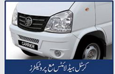
کرشل ہیڈ لائٹس مع پروٹیکٹرز