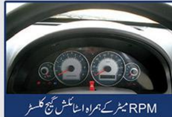
RPM میٹر کے ہمراہ اسٹائٹس گیج کلسٹر