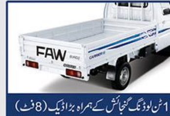
1 ٹن لوڈنگ گنجائش کے ہمراہ بڑا ڈیک (8 فٹ)