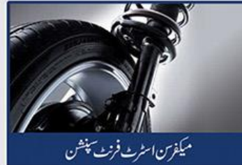
میگنٹن اسٹرنٹ فرنٹ سپنشن